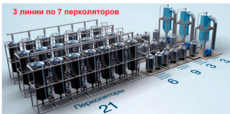
Рис. 5. Традиционная линия получения растворимого порошка цикория производительностью 390 кг/ч по исходному обжаренному цикорию