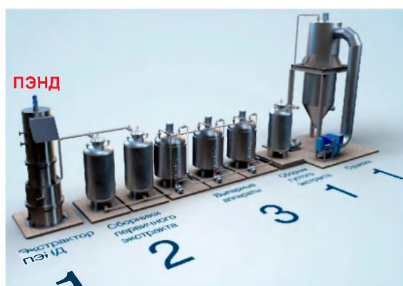
Рис. 6. Линия получения растворимого порошка цикория после модернизации с применением ПЭНД производительностью 400 кг/ч по исходному обжаренному цикорию