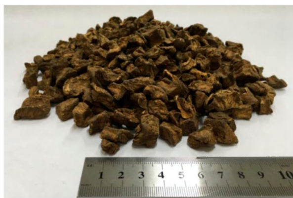
Рис. 4. Обжаренный цикорий с размерами дробления 5–20 мм, использованный для экстрагирования в ППУ.

85°C, время экстрагирования составляло 1 час. Температура и время были приняты исходя из условий оказания минимального влияния данных параметров и проведения экстрагирования в мягком щадящем режиме для сохранения полезных веществ. При этом ставилась задача достигнуть на указанной фракции сырья показателя эффективности экстрагирования в пульсационном режиме не хуже,