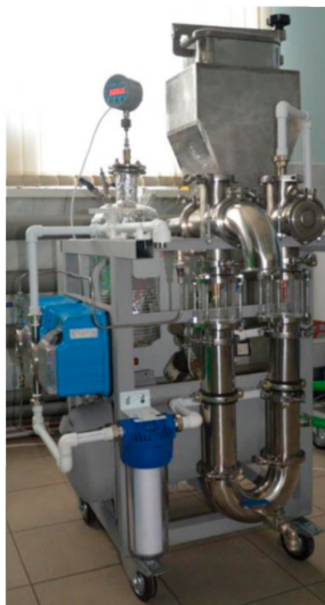
Рис. 3. Пилотная пульсационная установка (ППУ) для экстрагирования