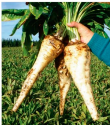
Рис. 1. Цикорий корнеплодный

Цикорий в промышленных объемах может перерабатываться для получения жидких, сиропобразных и порошковых экстрактов, выпуска инулиносодержащих