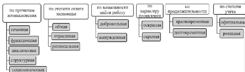
Рис. 1. Классификация безработицы

После введения иностранных санкций западным компаниям пришлось свернуть производство и деятельность в России. Некоторые из них взяли time-out и надеются на быстрое возвращение. Однако немало и таких компаний, которые окончательно покидают российский рынок, что ведет к волне сокращений. Таким образом, эксперты предупреждают, что если не вмешиваться в данную ситуацию, то нас ждет повышение числа безработных.