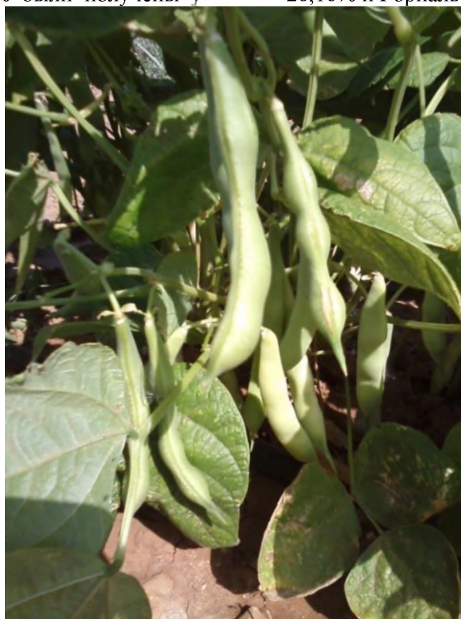
Рис. 1. Фасоль сорт Ока (st)

В ходе биохимического анализа было установлено, что максимальные значения содержания белка в зерне из всех сортов находящихся в изучении оказались у сорта Ока - 26,62%, Нерусса - 26,16% и Горналь- 26,53% (рис. 2).